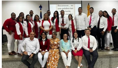
Emergenciólogo del Cabral y Báez realizaron su 5to simposio