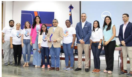
Residencia de Neurología del hospital Cabral y Báez celebra IV Symposium