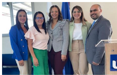
Audidores médicos realizan primer encuentro en la zona norte