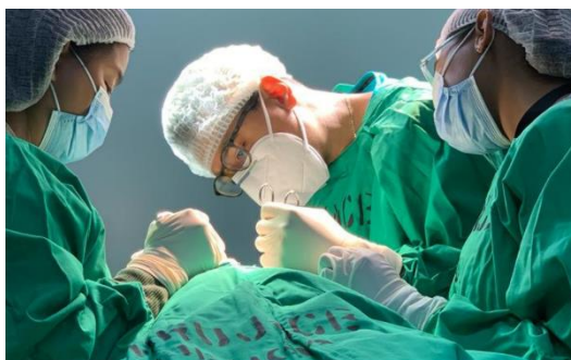
Dpto. de Cirugía General de este hospital realizó una jornada a pacientes con padecimientos coloproctológicos