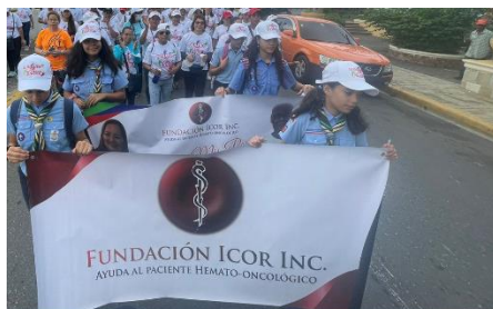
Fundación ICOR realizó caminata de apoyo a pacientes Oncohematológicos