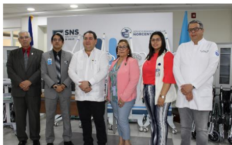
Hospital Cabral y Báez recibe más de RD$ 2 millones de pesos en equipos por parte del director del SNS